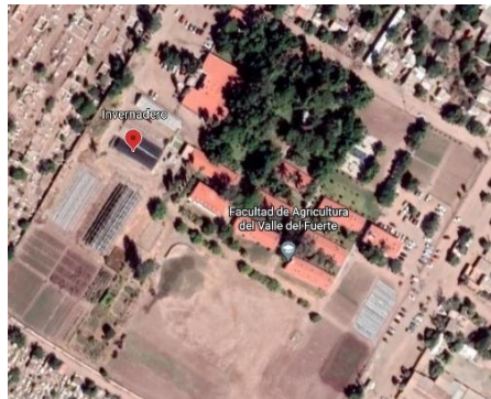
Figura 3. Localización geográfica de la Facultad de Agricultura del Valle del Fuerte (FAVF).

El experimento se realizó en un invernadero situado en la Facultad de Agricultura del Valle del Fuerte (Universidad Autónoma de Sinaloa, Juan José Ríos, Sinaloa, México) (25°75'58" N y 108°83'97" W, altitud de 12 m) (Figura 3).