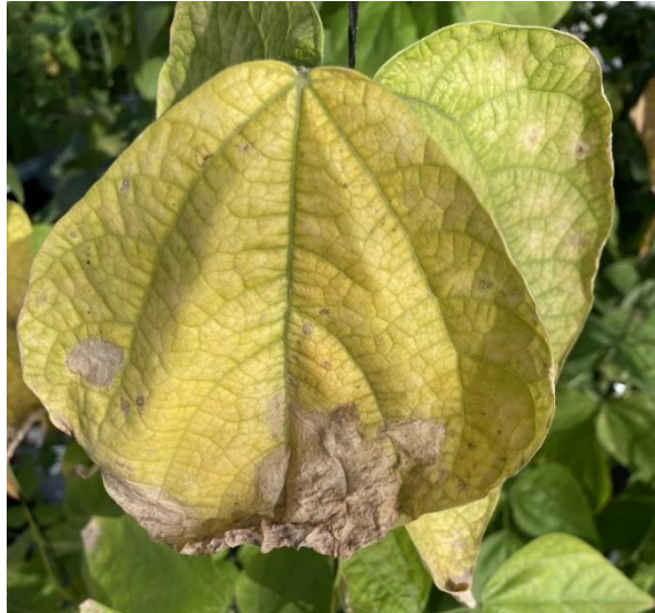
Figura 2. Daño característico en hojas de frijol, debido a la exposición de altas concentraciones de NaCl.

las paredes celulares o en el citoplasma, y a la incapacidad de las vacuolas de retener la entrada de sales (Figura 2). Así, la acumulación de sales en las hojas disminuye el suministro de carbohidratos y reguladores de crecimiento en la región meristemática, limitando el crecimiento, al mismo tiempo se reduce la tasa de fotosíntesis y además interviene en la producción de metabolitos específicos, que también inhiben directamente el crecimiento (Cassaniti et al. , 2012).