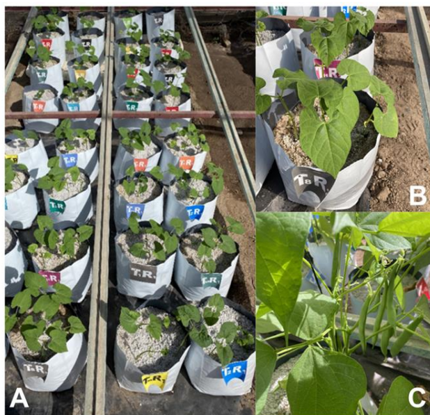
Figura 5. Efecto del estrés salino y la aplicación de bioestimulantes en dos variedades de frijol común bajo condiciones de invernadero. (A) Sitio experimental, (B) Crecimiento inicial, y (C) Etapa reproductiva.

Durante el otoño de 2022, cinco semillas de frijol de las variedades “Azufrado Higuera” (INIFAP) y “Reyna” (Comercializadora Internacional Arizona) se sembraron a 3 cm de profundidad, en bolsas bicolor de 35 x 35 cm con un grosor de 0.6 mm, con 10 L de perlita (Hortiperl, Termolita), dejando cuatro plántulas para determinar las variables de crecimiento inicial y una planta para cuantificar prolina, estimar el rendimiento y sus componentes (Figura 5).